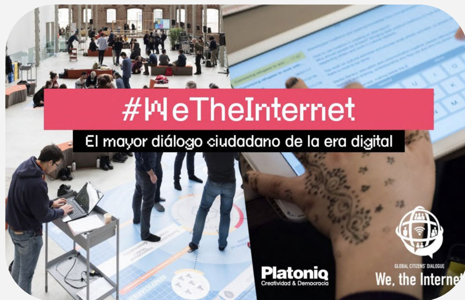
Proyecto #WeTheInternet, Platoniq 2020