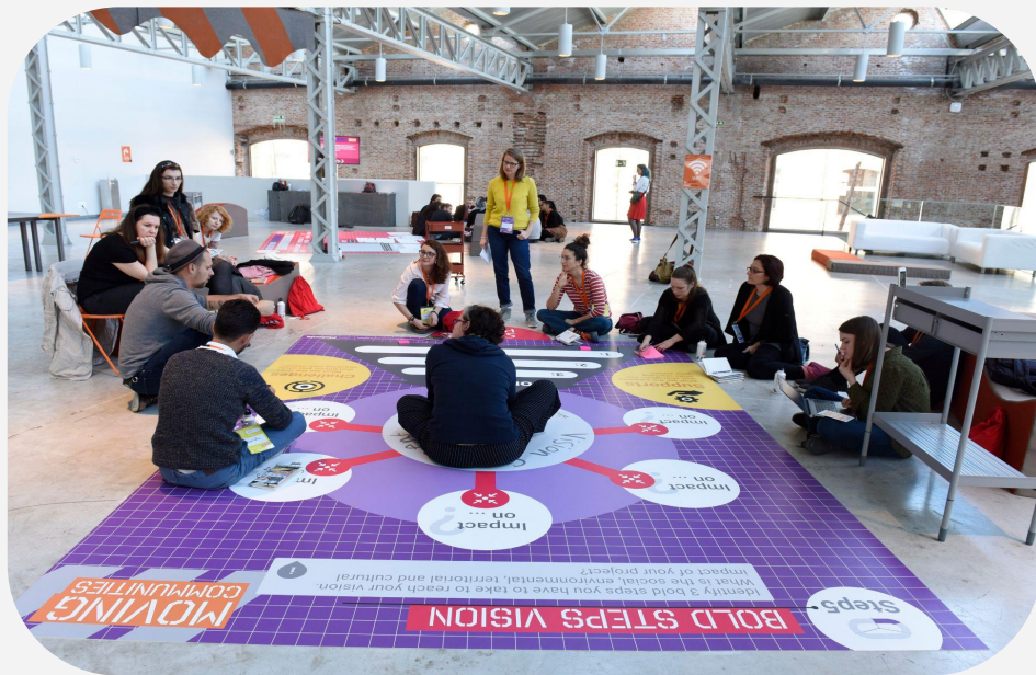
Proyecto Moving Communities, Platoniq 2021