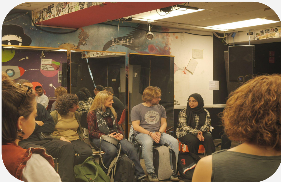
Proyecto Mindset Revolution, Platoniq 2024