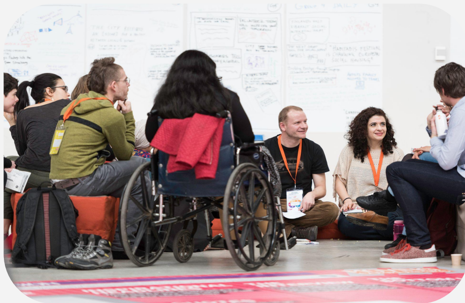
Proyecto Idea Camp, Platoniq